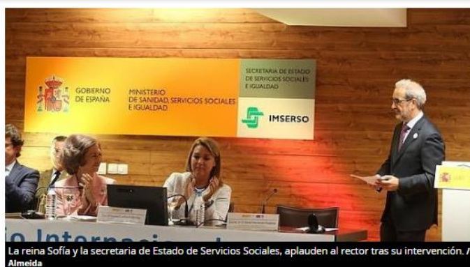
La reina Sofía y la secretaria de Estado de Servicios Sociales, aplauden al rector tras su intervención.