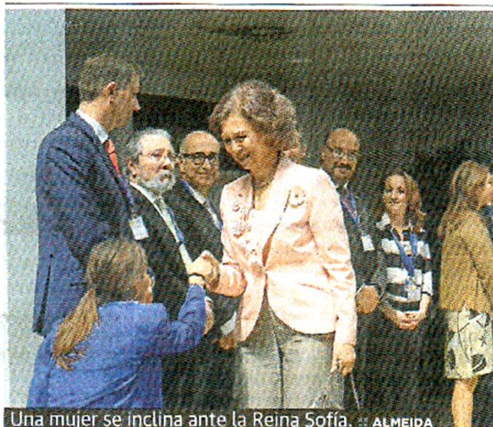
Una mujer se inclina ante la Reina Sofía.

La Reina Sofía preside el IV Simposio sobre la Enfermedad de Alzheimer en Salamanca P2