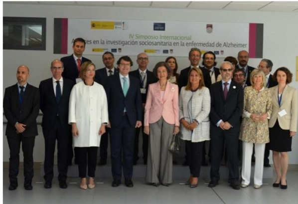
La Reina Sofía inauguró el IV Simposio Internacional 'Avances en la Investigación Socio-Sanitaria en la Enfermedad del Alzheimer'.

La Reina Sofía inauguró el IV Simposio Internacional 'Avances en la Investigación Socio-Sanitaria en la Enfermedad del Alzheimer'. Este encuentro tiene como objetivo este año la necesidad de convertir los centros residenciales en auténticos hogares, siendo el CRE de Salamanca un centro puntero que está al día de los últimos descubrimientos y de técnicas más innovadoras