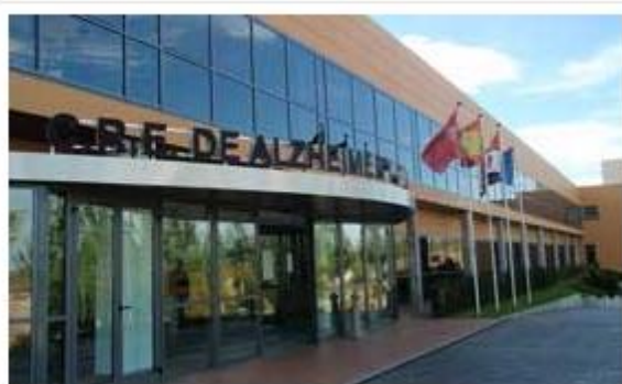
El IV Simposio Internacional Alzheimer se desarrollará bajo la presidencia de Su Majestad la Reina Doña Sofía

El IV Simposio Internacional Alzheimer tendrá lugar el 2 de junio bajo el epígrafe “Avances en la Investigación Sociosanitaria en la Enfermedad de Alzheimer” en el CRE Alzheimer , el Centro de Referencia Estatal de Atención a Personas con Enfermedad de Alzheimer y otras Demencias del Imsero en Salamanca.