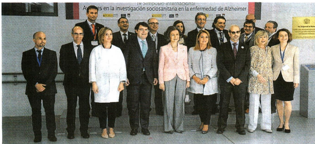
La Reina Sofía junto a las autoridades en la inauguración de la reunión ayer en Salamanca.