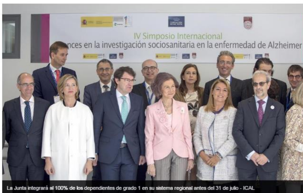
La Junta integrará al 100% de los dependientes de grado 1 en su sistema regional antes del 31 de julio - ICAL