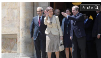
La reina Sofía en el pasado Simposio.

La reina Sofía acudirá este próximo jueves a Salamanca para inaugurar, a partir de las 12.00 horas, el IV Simposium Internacional 'Avances en la investigación socio-sanitaria de la enfermedad del alzheimer' que se celebra en el Centro de Referencia Estatal de atención a personas con enfermedad de alzheimer y otras demencias, según dio a conocer este viernes la Subdelegación del Gobierno en Salamanca.