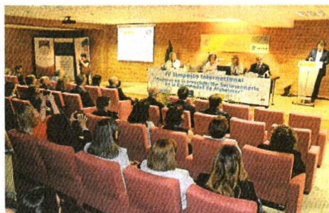
Mucha expectación en el Centro de Alzheimer durante la jornada.