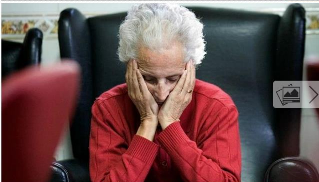
Siete de cada diez muertos por alzhéimer en España son mujeres