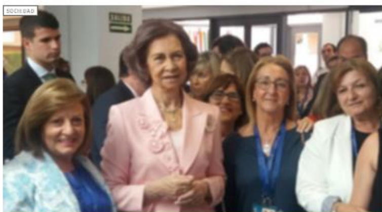
La presidenta de AFA Ceuta participa en el IV Simposio Internacional sobre Alzheimer.

Entre los objetivos principales de la Asociación de Familiares de Enfermos de Alzheimer de la Ciudad Autónoma de Ceuta siempre ha estado el interés en la Formación Continua de su personal y Junta Directiva.