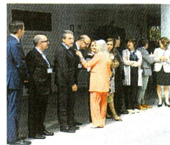
Últimos detalles ante la llegada de la Reina.