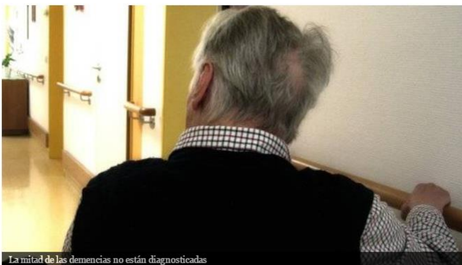
La mitad de las demencias no están diagnosticadas

El doctor Martínez-Lage alerta del problema que supone el infradiagnóstico: “No se puede diagnosticar en diez minutos la demencia en atención primaria”