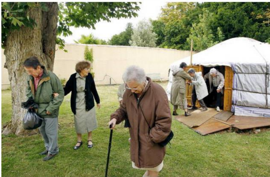
Imagen de archivo de varias personas enfermas de Alzheimer.