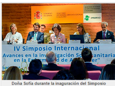
Doña Sofía durante la inauguración del Simposio

S.M. la Reina doña Sofía ha inaugurado hoy en la ciudad de Salamanca el IV Simposio Internacional "Avances en la Investigación Socio-Sanitaria en la Enfermedad de Alzheimer", un espacio de encuentro a nivel internacional con el objetivo de reducir la prevalencia, la incidencia y los efectos del Alzheimer, así como mejorar los tratamientos, las perspectivas y la calidad de vida de los enfermos y sus familias.