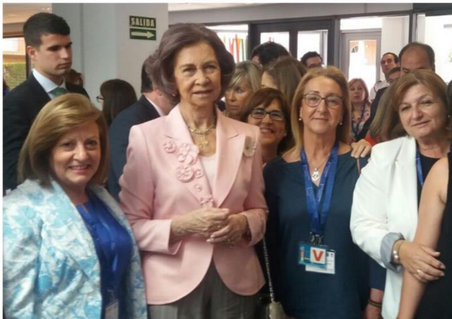
La presidenta de AFA junto a la Reina Sofia

TAGS: ALZHEIMER SALAMANCA CEUTA NOTICIAS