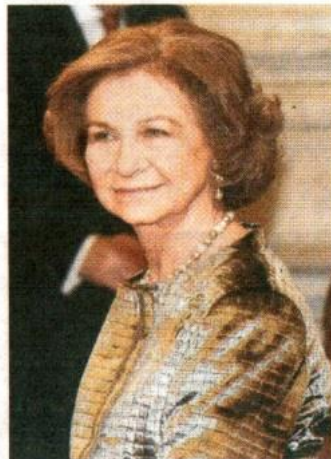
Su Majestad la Reina Sofía.

Su Majestad presidirá las sesiones de debate de un simposio que este año trata de ofrecer una mirada actual sobre el Alzheimer, así como las últimas investigaciones y la perspectiva de futuro sobre dicha enfermedad y la investigación sociosanitaria. En esta ocasión, el país invitado es Argentina, que acude a este