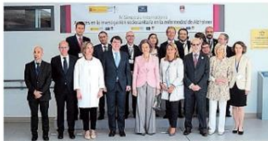
La asistencia al IV Simposio Internacional sobre Avances en la Investigación Sociosanitaria

Técnicas terapéuticas para el tratamiento o demora en el desarrollo de Alzheimer