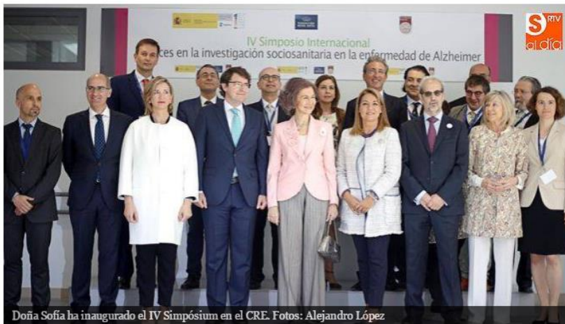
Doña Sofía ha inaugurado el IV Simposium en el CRE.

Doña Sofía inaugura el IV Simposium Internacional de una enfermedad con "rostro de mujer", de la que mueren siete de cada diez