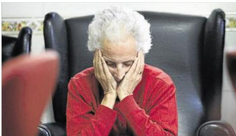
Las mujeres mayores son las más afectadas por el alzhéimer.