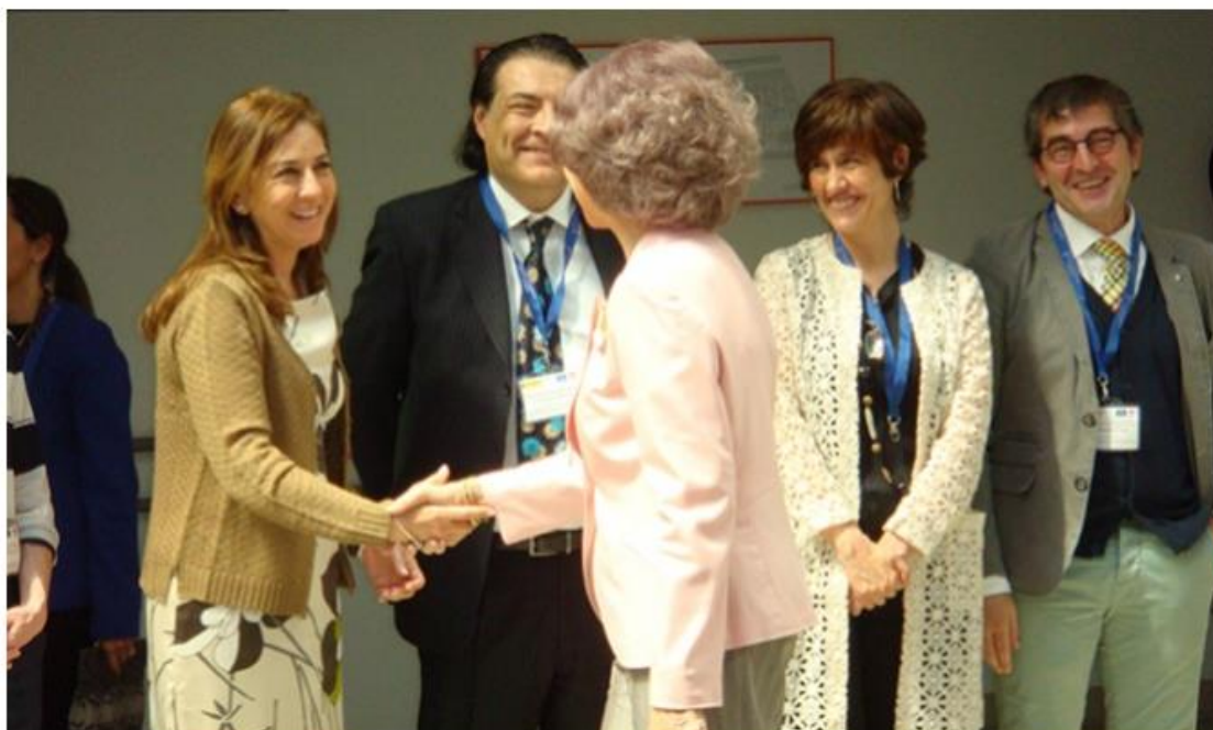
La Reina Sofía saluda a alguno de los ponentes.

En los países de renta alta "habrá una disminución de afectados por demencia", pero el verdadero reto se producirá en los países en vías de desarrollo a medida que envejezca la población, "porque se triplicarán y cuadruplicarán los casos, ahí nos debemos centrar".