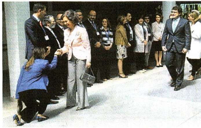
Una miembro de la comitiva de bienvenida realiza una genuflexión ante la Reina Sofía.

Por lejanía del centro de la ciudad, (la visita era en el Centro de Alzheimer en la zona de Vistahermosa) o por su condi-