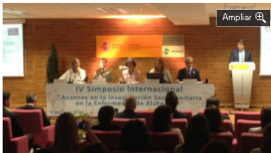
La reina Sofía, en la mesa presidencial del simposio.

En esta cita se reúnen numerosos especialistas internacionales en terapias no farmacológicas para frenar el desarrollo de esta patología.