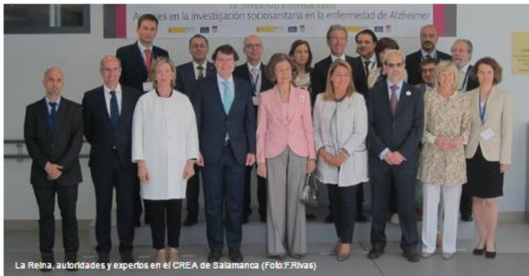
La Reina, autoridades y expertos en el CREA de Salamanca