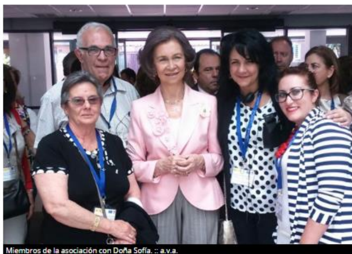
Miembros de la asociación con Doña Sofía.

Durante el transcurso de la cita, en el que también participaba la Fundación Reina Sofía, los miembros de AVA recibieron el apoyo de la propia Doña Sofía por la labor que están llevando a cabo, quién no dudó en fotografiarse con la comitiva verata