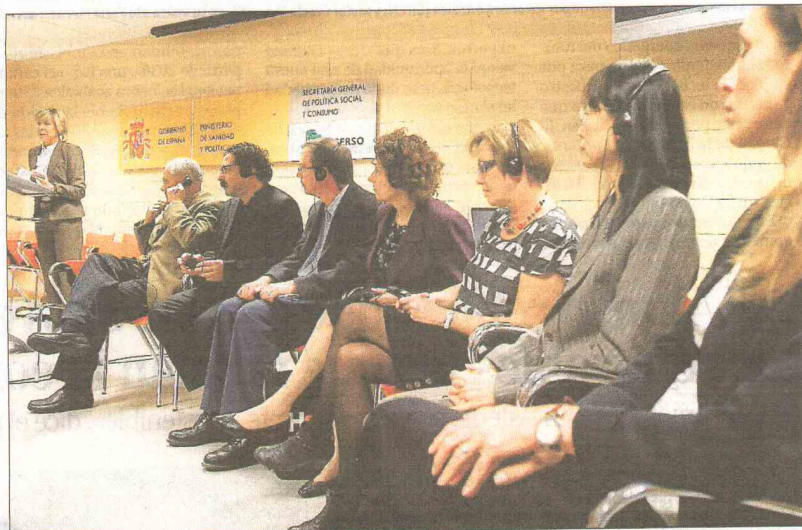
Los expertos internacionales en terapias no farmacológicas que ayer debatieron en Salamanca.

En ese sentido, la red será abierta y abordará temas como los modelos de intervención social, el diseño de interiores y arquitectura o modelos de calidad de vida o el uso de la tecnología.