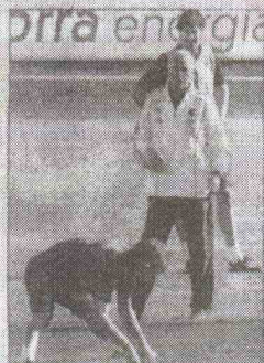
Ramos, Del Bosque y Llorente

La Unión, a la final de la Copa Federación tras ganar al Palencia