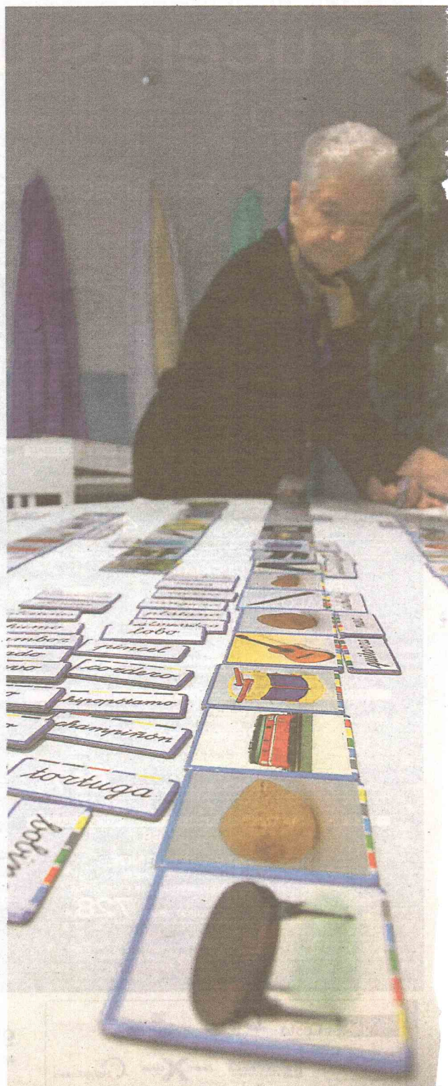
Los juegos de memorización son fundamentales en las terapias.

sionales sanitarios como a los familiares que comparten gran parte de su tiempo con los enfermos. Por ella han pasado ya más de 1.500 personas, cuya estancia en las instalaciones durante el período formativo es completamente gratis.