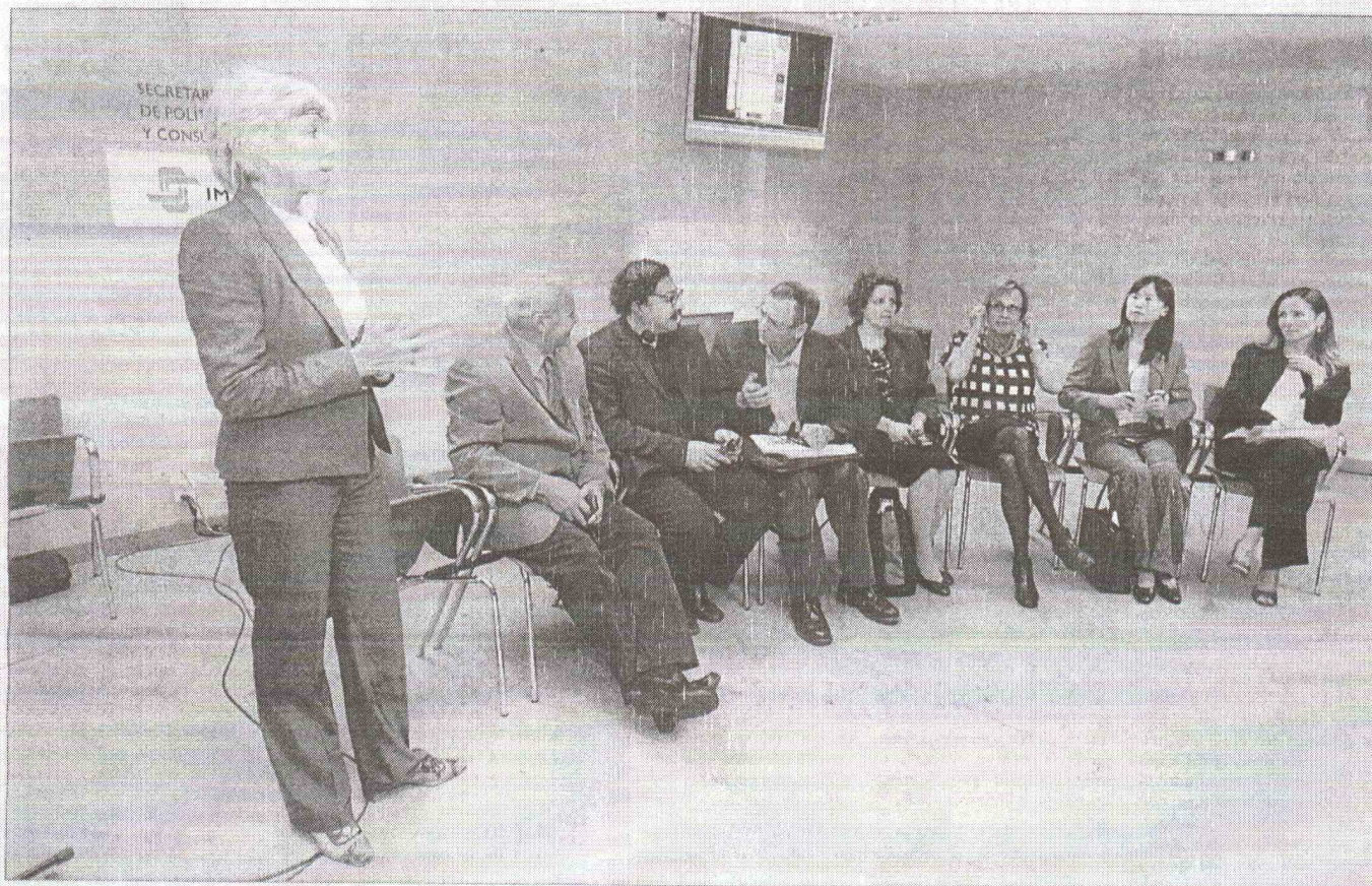
Reunión la semana pasada en el CRE Alzheimer de Salamanca.

EL CENTRO DE REFERENCIA ESTATAL DE SALAMANCA ACOGIÓ LA SEMANA PASADA UNA REUNIÓN DE EXPERTOS CON EL OBJETIVO, A MEDIO PLAZO, DE CREAR UNA RED MUNDIAL DE ESPECIALISTAS EN DEMENCIAS