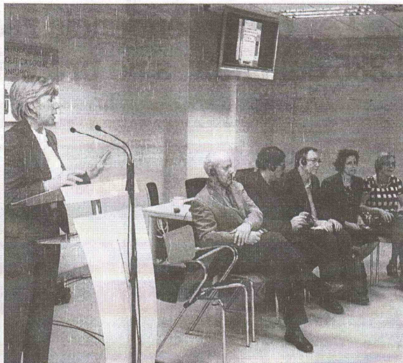
La directora del CRE de Alzheimer, durante su intervención en la reunión de expertos de ayer