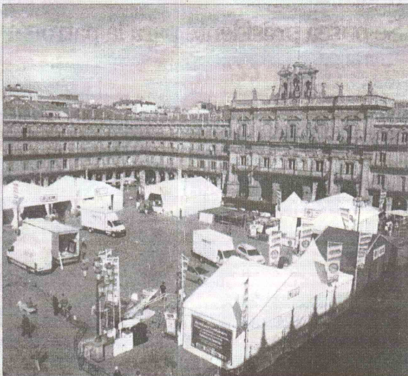
El Club Selección ofrecerá actividades y la posibilidad de fotografiarse con los trofeos de la Eurocopa y el Mundial

Especial Liga Femenina: Avenida, a por los tres títulos nacionales