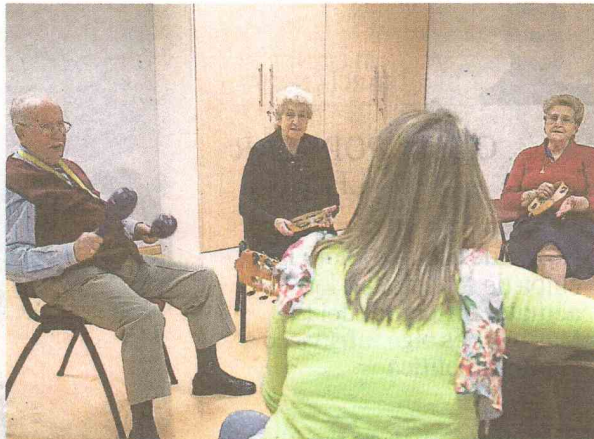
La musicoterapia es uno de los módulos que más gusta a los pacientes

Hay campos en los que hemos mejorado los objetivos propuestos. Uno de estos objetivos se ha materializado en los seminarios que se están realizando y los que se van a llevar a cabo hasta la celebración en 2011 del Congreso Internacional