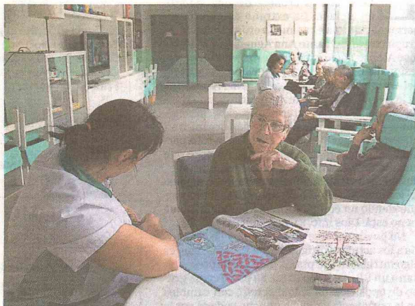
El centro trabaja con los pacientes durante seis meses y sin coste

centro de Alzheimer. ¿Cómo es la relación existente con éste y otros centros?