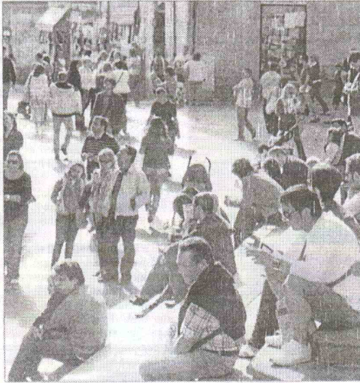
Así lucía la entrada de la Casa de las Conchas en el puente de la Constitución de 2009. ALMEIDA

El representante hotelero es, no obstante, optimista y confía en que a lo largo de hoy y mañana aumentan las reservas