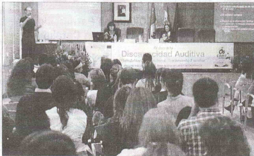
Jornada de discapacidad auditiva en el CRMF de Salamanca, donde participan expertos en la materia

El Centro de Recuperación de Personas con Discapacidad Física y/o Sensorial de Salamanca (CRMF) albergó ayer la IV Jornada sobre Discapacidad Auditiva que en esta ocasión estaba centrada en el tema de Rehabilitación funcional. Tratamiento familiar . Para su desarrollo contó con la colaboración de numerosos expertos en la materia, como profesores de Logopedia, el presidente de la Federación de Asociaciones de Personas Sordas o el coordinador de intérpretes de lengua de signos española, entre otros.