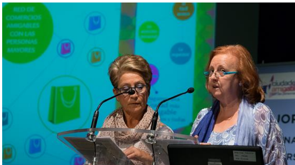
Una voluntaria del proyecto explica su cometido durante la jornada que sobre Ciudades Amigables desarrolló el Imserso en Zaragoza.

Recientemente el Ayuntamiento ha publicado una guía informativa que explica con más detalle el proyecto, y da consejos para hacer a cualquier comercio más amigable con las personas mayores.