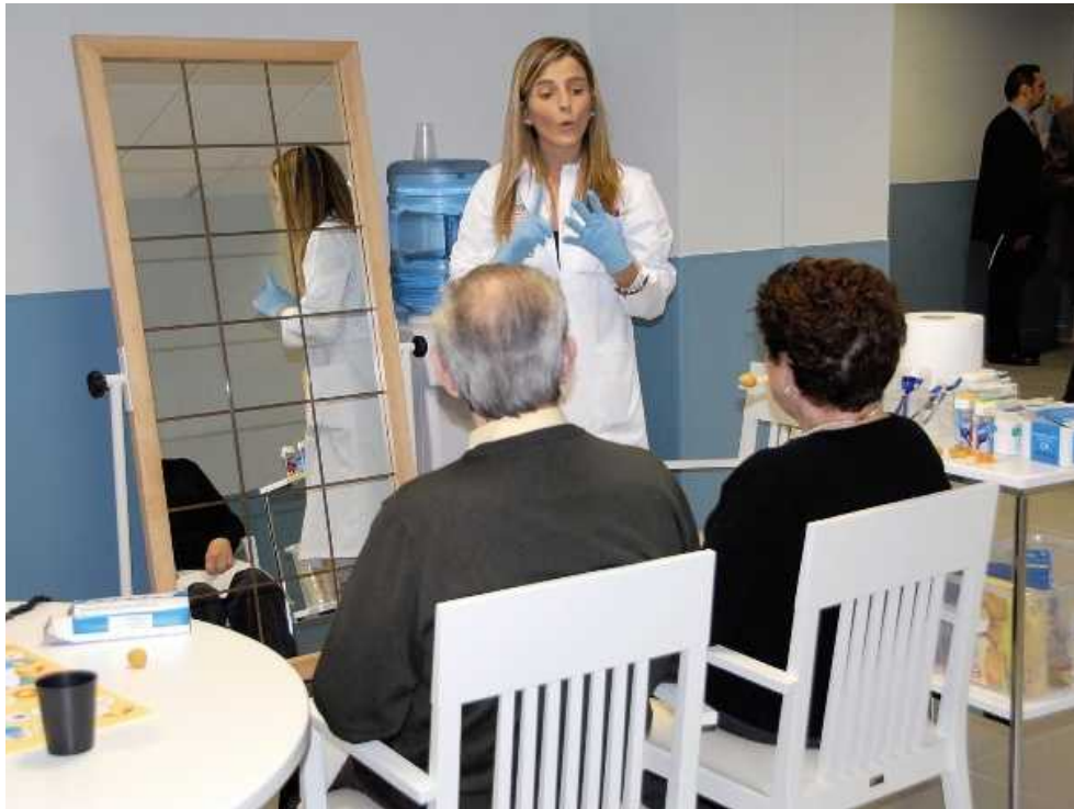
Los programas que se aplican están orientados a la intervención no farmacológica

La verdadera característica distintiva de este centro de Alzheimer, ubicado en Salamanca, consiste en que los pacientes con Alzheimer pasan en él una estancia temporal en la que mediante una investigación se les dictamina la terapia que tienen que seguir para que se les aplique en sus centros de origen, que aunque no sirva para curarles la enfermedad, si la puede ralentizar, para lo que se utilizan terapias no farmacológicas.