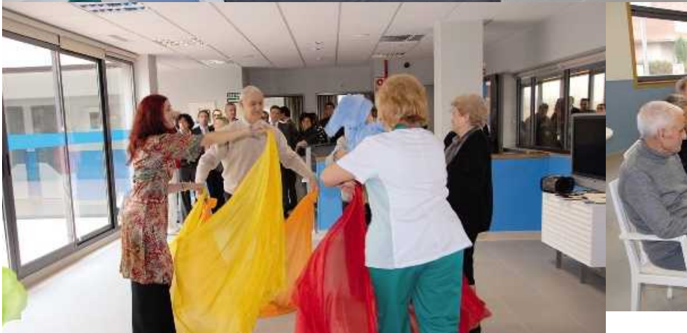
El proceso de la enfermedad con la estimulación se ralentiza, aunque el Alzheimer no tenga cura

manca, con CEAFA, con grandes fundaciones, además de protocolos que se convertirán con el tiempo en convenios.