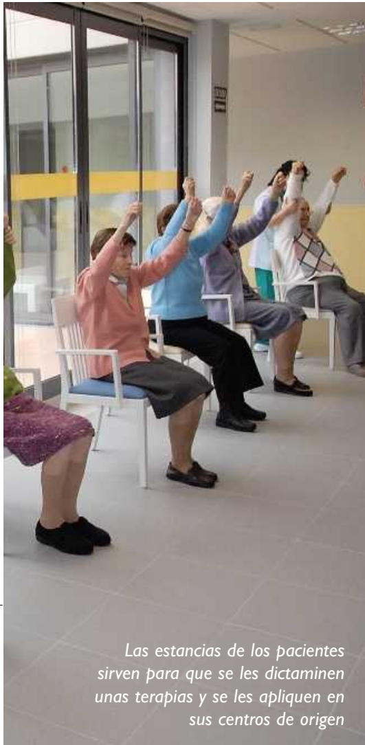
Las estancias de los pacientes sirven para que se les dictaminen unas terapias y se les apliquen en sus centros de origen