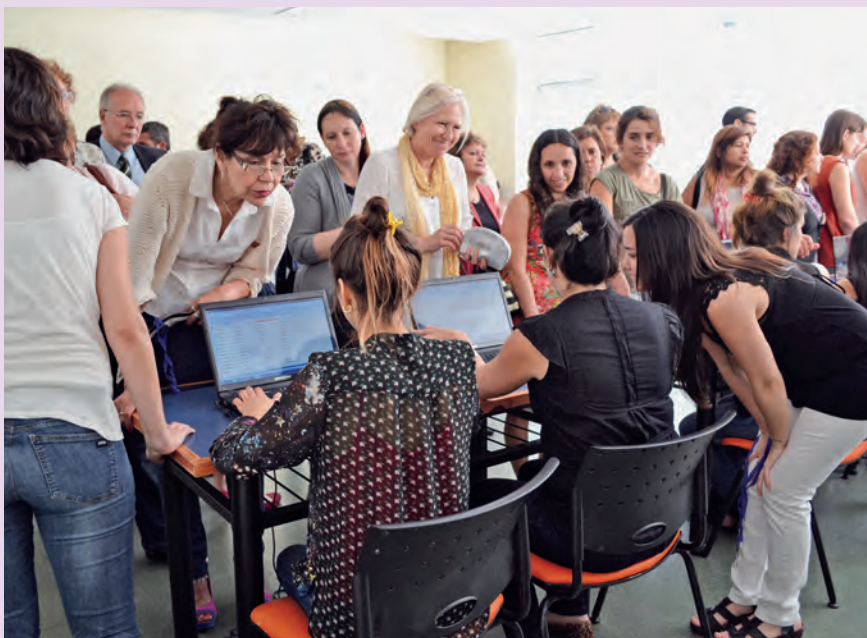
Un grupo de participantes en el Congreso inscribiéndose en las diferentes comisiones de trabajo.

Buenos Aires, ha organizado de nuevo el II Congreso Latinoamericano de Gerontología Comunitaria . Además ha contado con el apoyo, entre otras organizaciones, de RIICOTEC y del Imsero.