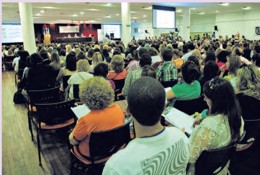
Aspecto general del plenario.

“ Los dos objetivos básicos eran crear un espacio donde los distintos países pudieran encontrarse para intercambiar estrategias, acciones, políticas y programas, con el fin de enriquecer a toda la región y por otro lado, capacitar profesionales y técnicos de Latinoamérica en la temática de la gerontología comunitaria ”