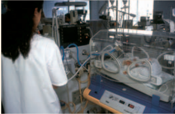
Sala de cuidados intensivos para bebés con problemas

G arantizar el empleo y la atención sanitaria a las personas con discapacidad son dos iniciativas contempladas en el Anteproyecto de Ley Orgánica de Atención Integral a la Discapacidad. Según se avanza en el documento, los organismos estatales, nacionales y municipales y las empresas públicas, privadas o mixtas venezolanas tendrán que emplear al menos, a un 5% de personas con discapacidad. El texto refleja la gratuidad de los tratamientos médicos para estas personas, tanto en diagnóstico, hospitalización, cirugía, rehabilitación integral, como en me-