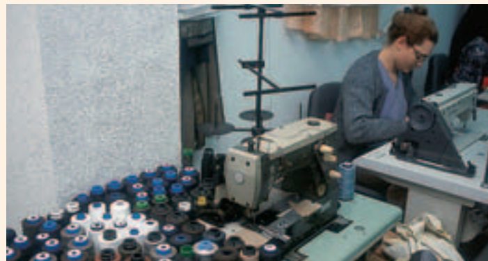
El Plan Concertado de Servicios Sociales aumenta un 7,7% en relación a lo presupuestado en 2004

Los Planes y Programas a los que se distribuyen los diez créditos aprobados por Ministerio de Trabajo y Asuntos Sociales (MTAS) son Plan Concertado, Plan de Acción para Personas con Discapacidad, Plan de Acción para Mayores; Programas Atención Primera Infancia