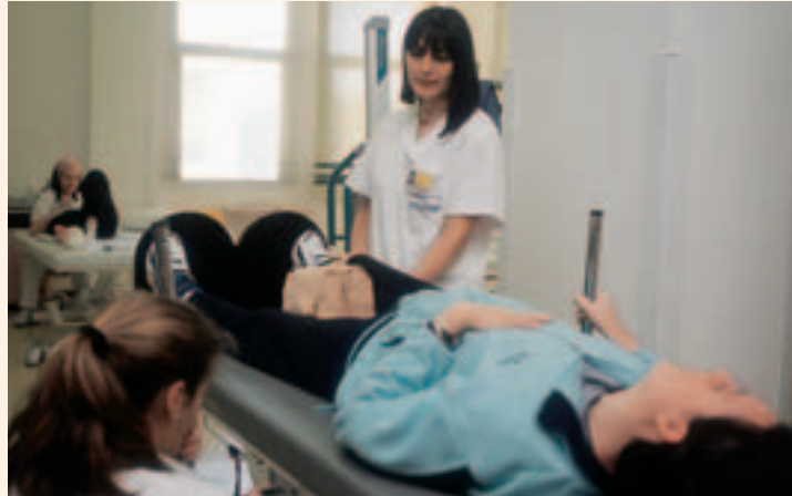
Profesional del CEADAC en una sesión de rehabilitación

rollar su ciclo vital con la máxima autonomía, para su mayor integración en el ámbito escolar y social y una mejora de su calidad de vida.