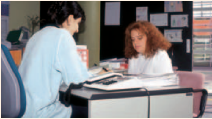
MADRID / MINUSVAL

La necesidad de aumentar las oportunidades de cada persona con políticas sociales activas favorables para todos, fue la principal conclusión del encuentro entre los ministros de Asuntos Sociales de la Organización para la Cooperación y Desarrollo Económicos (OCDE).