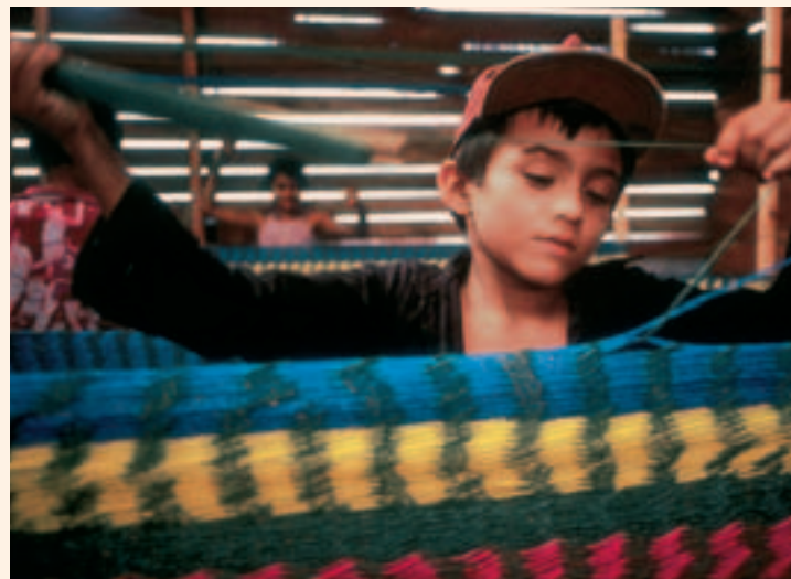
Trabajador en un taller de empleo

También se indica que el 89% de las 37 cooperativas encuestadas (sector transportes, seleccionadas en función de las necesidades de la población con discapacidad), muestran interés en abordar el tema. Como contrapartida, menos del 1% de los asociados a estas cooperativas tiene discapacidad. En Costa Rica sólo existen dos cooperativas integradas por personas con discapacidad, COOPECIVEL