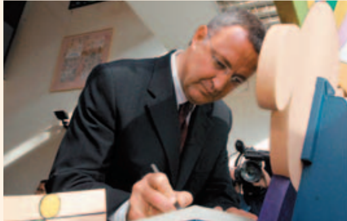
El ministro de Trabajo y Asuntos Sociales Jesús Caldera en el acto de inauguración

El edificio de ampliación del Centro de Día en el barrio de Fuentesillas ha sido construido en un terreno cedido por el Ayuntamiento de Burgos y financiado en un