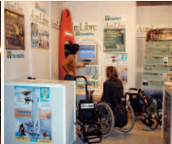
El stand de PREDIF, a la izquierda, y el de Aire libre y Fundación También, a la derecha

para la atención a personas con discapacidad intelectual y a sus familias para facilitar las vacaciones a este colectivo, ha tenido su punto de arranque en FITUR 2005.