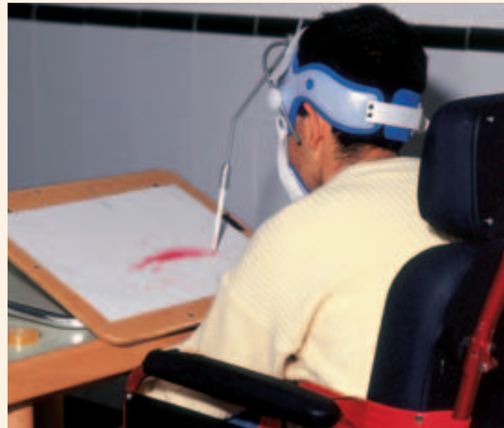
En el CAMF de San Andrés de Rabanedo (León) se atenderá a personas con discapacidad física grave que encuentren grandes dificultades para ser atendidos en su entorno familiar

El objetivo de este CAMF —uno de los principales proyectos asistenciales del Ministerio