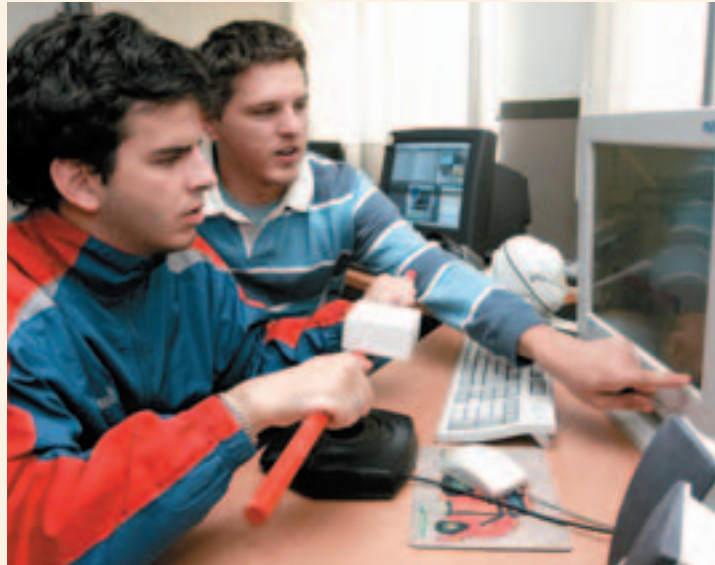
Alumnos de la Asociación Autismo Burgos