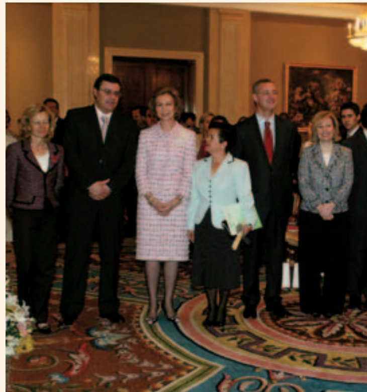
Los galardonados, tras recoger el Premio, acompañados por la Reina Doña Sofía, el ministro de Trabajo y Asuntos Sociales, Jesús Caldera, la ministra de Sanidad y Consumo, Elena Salgado y la secretaria de Estado de Servicios Sociales, Familias y Discapacidad, Amparo Valcarce

Los galardones están dotados con 48.000 euros por la Fundación Pedro Barrie de la Maza, Conde de Fenosa y el Real Patronato sobre Discapacidad y fueron recogidos por el director de la Unidad