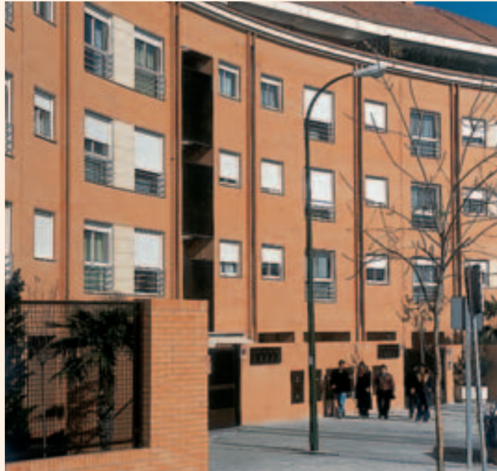
Entrada a un edificio adaptado

La iniciativa que se puso en marcha el pasado mes de febrero está apoyada en un tríptico de la Asociación de Padres de Minusválidos de Extremadura (APAMEX). La problemática de accesibilidad que presentan gran parte de los edificios está llevando a que las comunidades de vecinos se pongan manos a la obra, ante la imposibilidad de los propietarios o inquilinos con problemas de movilidad de poder acceder a sus viviendas libremente, sin la ayuda de terceras personas. En numerosas ocasiones, el propio afectado acude a la comunidad de veci-