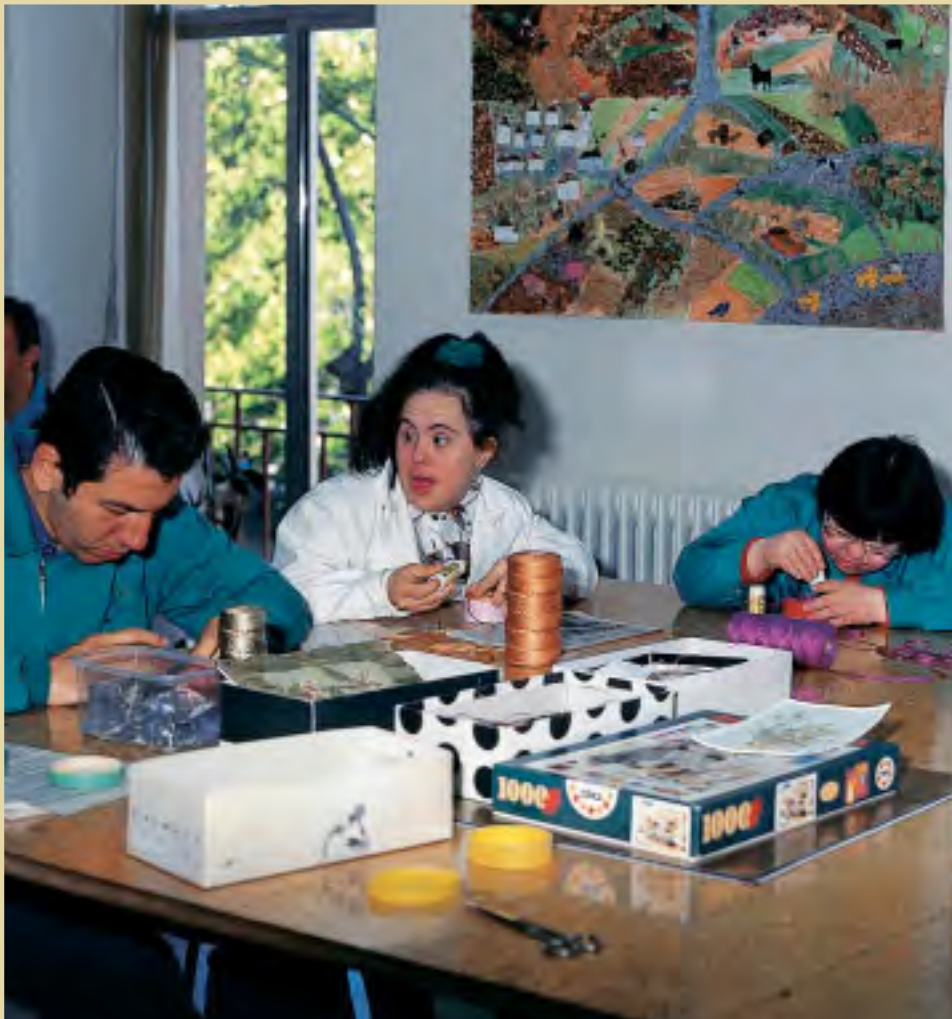
La declaración de incapacitación solamente corresponde al juez competente, que la dicta a través de una sentencia judicial y de acuerdo a unos supuestos de hecho que tienen que concurrir en la persona a la que se va a incapacitar

mueve la incapacitación a dirigir una demanda (algunos entienden que es una denuncia) contra su propio familiar; a quien quiere privar de la capacidad de obrar.