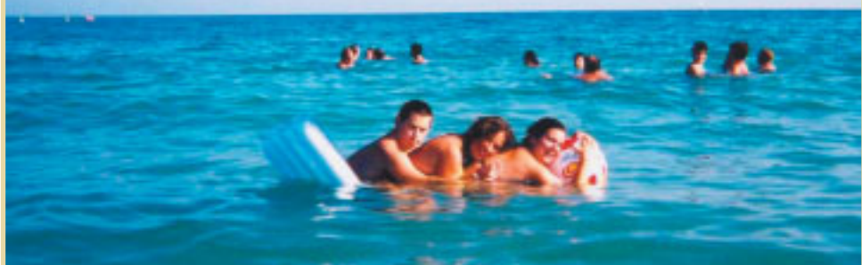
Cada beneficiario puede ir acompañado, ya sea de un familiar o de un amigo, para asistirle en las actividades de la vida diaria si la persona así lo requiere

IMSERSO, en Madrid: Avda. de la Ilustración, s/n, con vta. a Ginzo de Limia, 58. O bien a los teléfonos: 91 363 87 86, ó 91 363 88 01, donde me tiene a su disposición, y en la dirección de Internet anamartinezm@mtas.es .