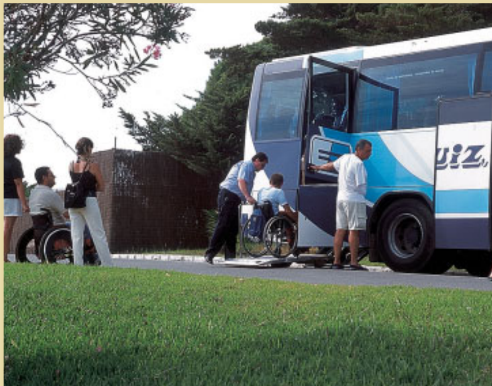
A diferencia de otros programas de turismo y termalismo para otros colectivos, los referidos a las personas con discapacidad no los ejecuta directamente el IMSERSO, sino que subvenciona a las entidades para que sean ellas mismas, como especialistas en la discapacidad, las que los lleven a cabo

Cada uno de estos dos programas se concreta en las siguientes acciones y objetivos: