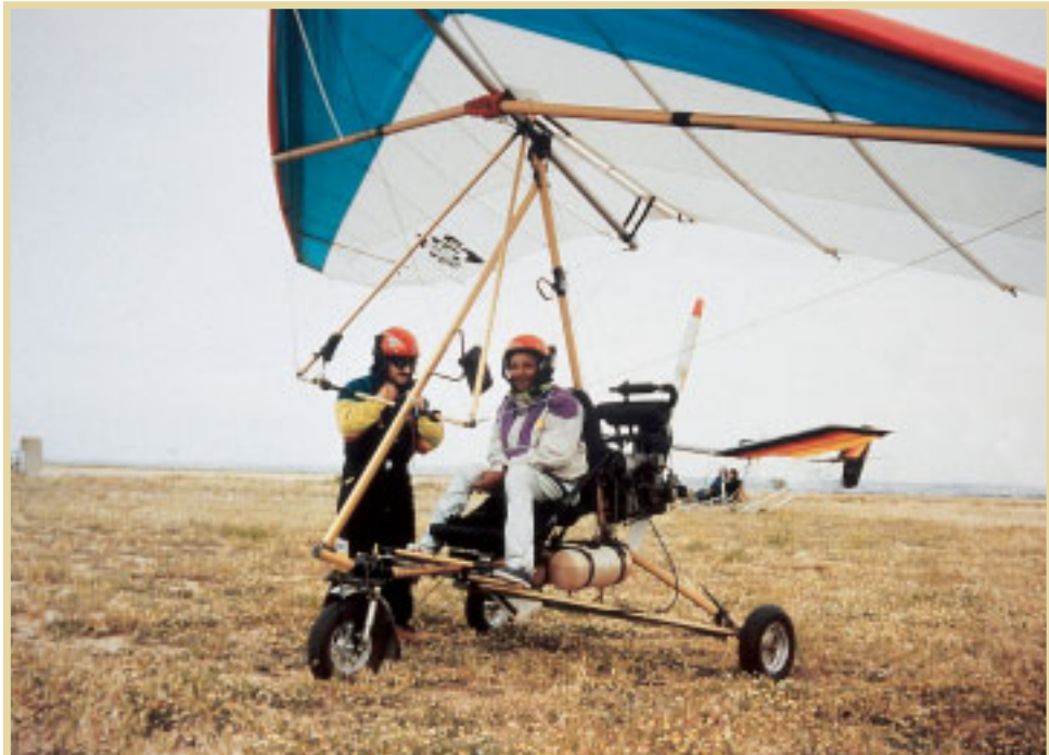
Todas las personas, discapacitadas o no, tienen necesidades de viajar, asistir a un espectáculo cultural, o caminar y pasear por un entorno lo más normalizado posible, sin barreras físicas ni mentales

Pues así, de repente, yo le diría a la lectora o al lector que está leyendo