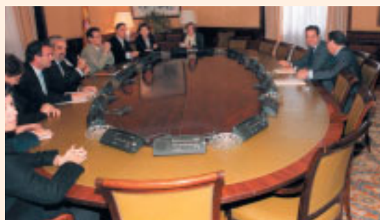
La Comisión del Congreso para el Pacto de Toledo entrega el documento al ministro de Trabajo y Asuntos Sociales

La Comisión No Permanente del Pacto de Toledo aprobó, el documento que constituirá el nuevo Pacto de Toledo con el que se renuevan las recomendaciones del anterior Pacto de Toledo de 1995 para garantizar la viabilidad del sistema público de pensiones, y que incluirá 22 recomendaciones al respecto. En este documento se aportan temas novedosos como