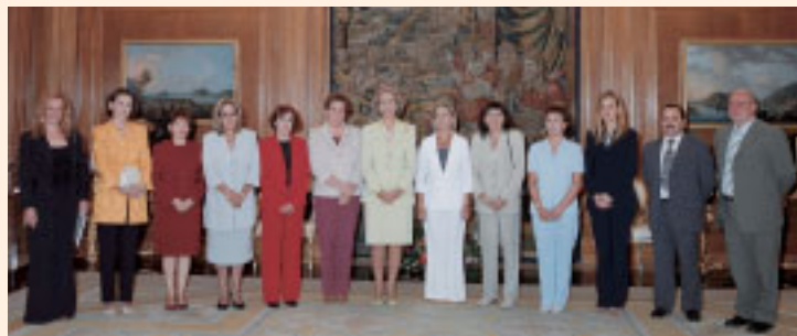
Encuentro de S.M. La Reina con los representantes de la Confederación Española de Familiares de Enfermos de Alzheimer

Con motivo de esta efemérides celebrada el 21 de septiembre 2003, S.M. La Reina Sofía recibió en audiencia a representantes de la Confederación Española de Familiares de Enfermos de Alzheimer (CEAFA), que le hicieron entrega de los últimos datos referentes a los costes de la enfermedad en España. Las esti-