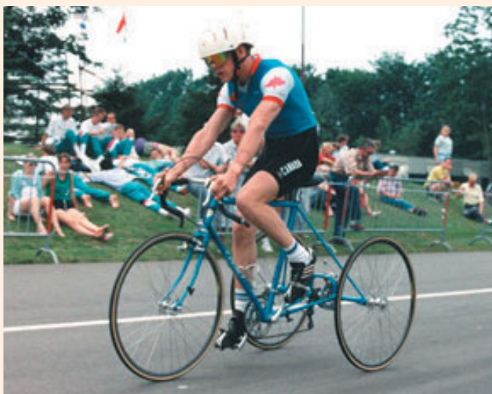
Ciclismo (paralíticos cerebrales)

Respecto al OPEN donde participaron países de otros continentes, los países ganadores fueron Australia con 26 medallas, Estados Unidos con 24, China con 20 y Alemania con 17. España se colocó en el cuarto puesto por países europeos y en el quinto puesto con 19 metales, de éstos, 5 medallas de oro.