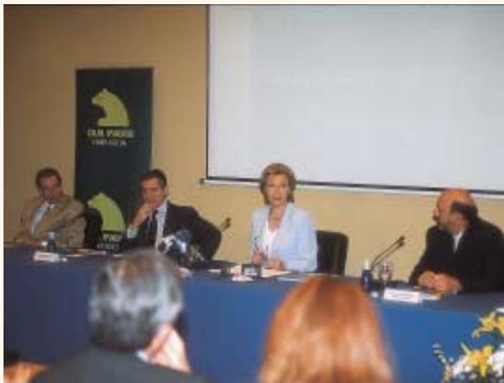
Mesa de presentación del Plan de Acción de Personas con Síndrome de Down.

El Plan de Acción para las personas con síndrome de Down (2002-2006) se presentó en la Obra Social de Caja Madrid en el mes de julio y su objetivo es facilitar la igualdad de oportunidades y mejorar la calidad de vida de las personas con síndrome de Down.