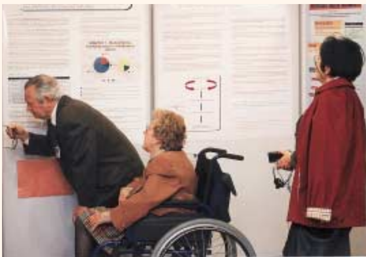
Barcelona acogió la última Asamblea General de EURORDIS.

La Organización Europea de Enfermedades Raras se dio cita en Barcelona para revisar sus planteamientos y marcar nuevos objetivos, nuevas estrategias para los próximos años. En el mismo lugar y día se hizo un llamamiento a la concienciación y se estudiaron nuevas alianzas nacionales. Todos ellos, motivos y razones oportunas para poner sobre la mesa el cúmulo de cuestiones que preocupan a los afectados de E.R. Enfermedades que hoy con motivo suficiente se hacen preguntas sin encontrar respuestas. Hoy las administraciones públicas, las empresas, pero, sobre todo la sociedad, está obligada a dar estas respuestas. Es un deber de conciencia y al mismo tiempo una gran injusticia que en nuestras