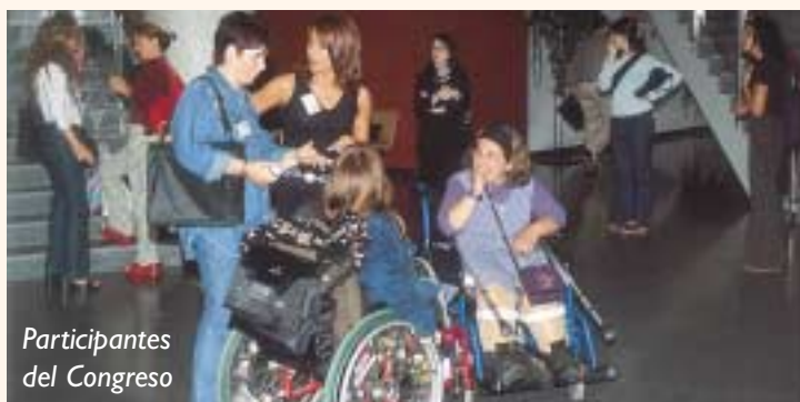
Participantes del Congreso

Con el objetivo de que la igualdad de oportunidades sea real y efectiva para los afectados de espina bífida se celebró el XI Congreso Estatal de Espina Bífida e Hidrocefalia en el palacio de Euskalduna de Bilbao, a finales del mes de junio.