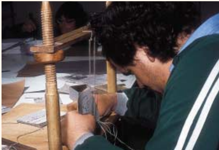
El programa de normalización promueve la adquisición de una serie de habilidades socioeducativas y psicológicas con talleres dentro del propio centro.

Favorecer la adquisición de habilidades educativas y psicosociales de cara a la futura rehabilitación y reinserción socio-laboral de reclusos con retraso mental en centros penitenciarios asturianos es el objetivo de este Programa.