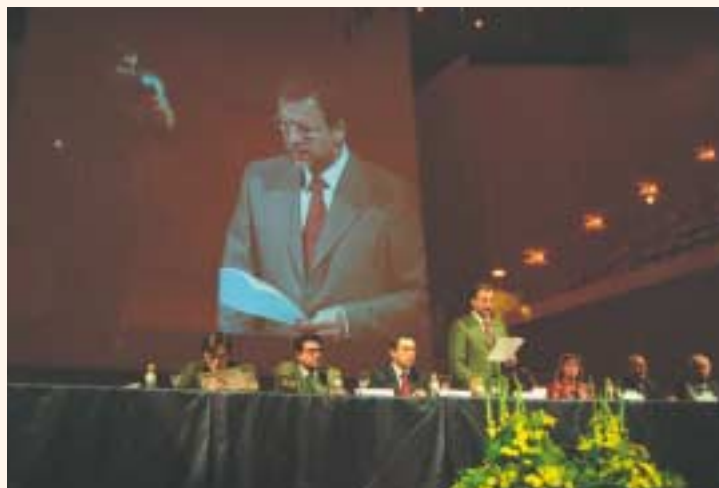
Mesa inaugural del III Congreso Nacional de Personas Sordas.

Se pide al ejecutivo la prioridad de establecer una Ley de Calidad Educativa que asegure una educación bilingüe para el