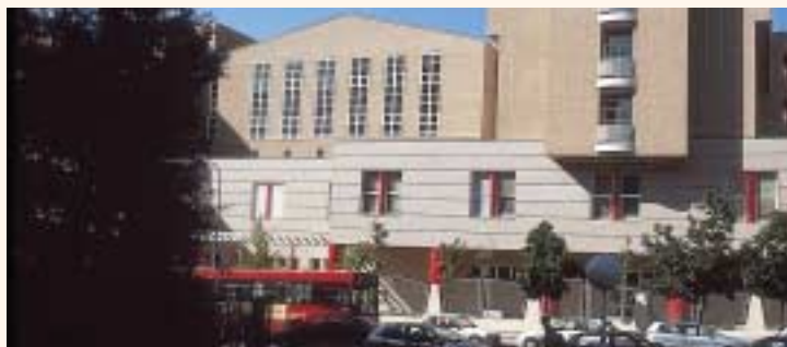
Sede del CEADAC

La I Jornada del daño cerebral se centró en la rehabilitación de las personas afectadas y el papel que juega en este sentido el Centro Estatal de Atención al Daño Cerebral, CEADAC, dependiente del IMSERSO, inaugurado en junio pasado.