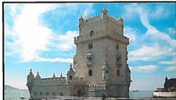
La VI Conferencia de Lisboa se desarrolló en un apretado programa durante tres días. En la foto, la famosa Torre de Belém lisboeta.