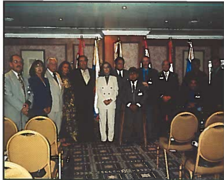
Participantes en la reunión de Caracas entre las contrapartes de la Región Andina (Ecuador, Colombia, Venezuela, Perú y Bolivia) y la Secretaría Ejecutiva.

La primera ha sido la encargada principalmente de la infraestructura de la Conferencia (lugar de celebración y de alojamiento de los participantes, recursos materiales y necesarios, etc.). La Secretaría Ejecutiva, por su parte, ha llevado a cabo, entre otras cuestiones, el proceso de acreditación de los participantes (información sobre los departamentos ministeriales competentes, solicitud de acreditación de representantes, remisión de la convocatoria); la elaboración del programa de actividades de la Conferencia y de la memoria de actividades del periodo y la recopilación y envío de la documentación que iba a entregarse en Lisboa.