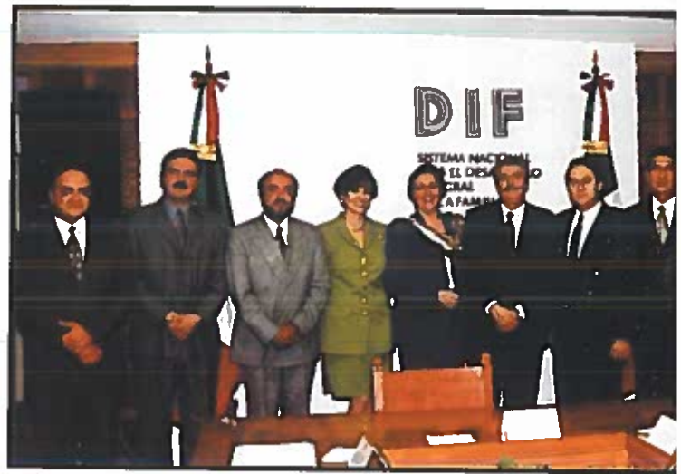
Equipo directivo del Sistema Nacional para el Desarrollo Integral de la Familia (DIF Nacional), organismo entre cuyas responsabilidades está la atención a los adultos mayores y a las personas con discapacidad.

En el acuerdo de creación se indica que el Consejo deberá invitar a sus sesiones, como mínimo, a cinco representantes de organizaciones sociales de reconoci-