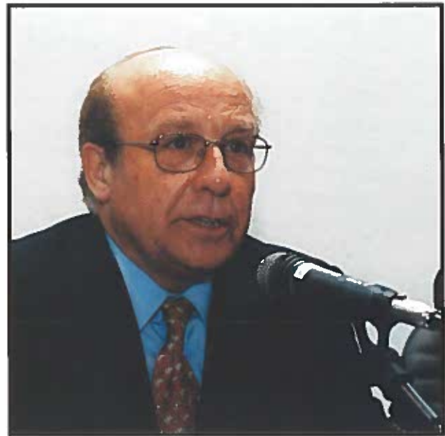
El Director General del IMSERSO calificó la Conferencia de momento trascendental.

Habló también de las numerosas asistencias técnicas y pasantías que se han desarrollado en los últimos años, que han ido fortaleciendo los lazos entre los distintos