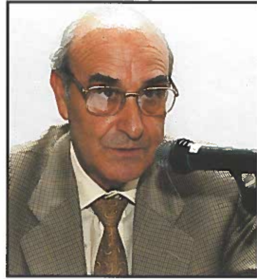
Adolfo Jiménez, Secretario General de la OISS.

— Los servicios sociales han sido históricamente, con seguridad, la última rama de la Seguridad Social en desarrollarse, tras la asistencia sanitaria y las prestaciones económicas. De hecho, incluso en Europa, donde los sistemas de Seguridad social son más avanzados, todavía su nivel es incipiente en muchos países. Por eso no puede extrañar que en Iberoamérica aún no hayan alcanzado un estado adecuado e, incluso, que en algunos países sean prácticamente inexistentes, al menos en su concepción actual como derechos subjetivos de los ciudadanos, confundiendo en muchas ocasiones con la asistencia social o incluso con la pura caridad. Sin embargo, esta situación está cambiando y ya em-