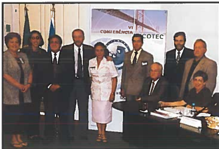
La Comisión Permanente de la RIAAM se reunió en Lisboa coincidiendo con la VI Conferencia.

1 La elaboración de proyectos de las Redes Nacionales, enviados a la Secretaría de Relaciones Internacionales, que ostentan las asociaciones españolas, para la búsqueda de vías de financiación. A pesar de no contar