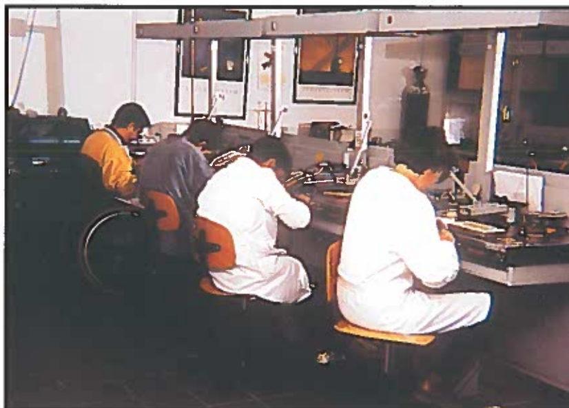
La tasa de paro de las personas con discapacidad es diez puntos más elevada que la de la población en general.

Otro dato de especial importancia es que 2.072.652, casi un 60 % del total de personas con discapacidad, son mayores de 65 años, lo que supone también un 32 % de la población de ese gru-