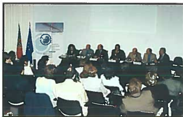
Fue significativa la presencia de representantes de instituciones y asociaciones iberoamericanas de discapacidad y adulto mayor.