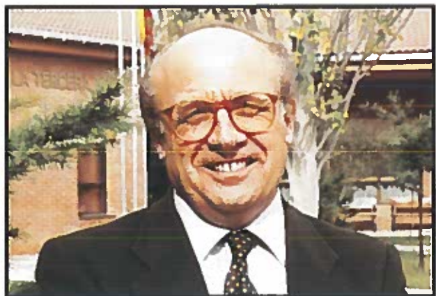
El Director General del IMSERSO

En ese contexto, el Director General del IMSERSO manifestó que el gobierno español era consciente de "la imperiosa necesidad de promover el crecimiento económico y el desarrollo social del resto de los países del mundo", sobre todo de aquéllos que "están pasando por una situación socioeconómica complicada y que ven difícil su despegue e incorporación al grupo de países desarrollados". Ese conocimiento ha movido a España a asumir compromisos internacionales del calibre de la II Asamblea Mundial del Envejecimiento o de la Conferencia Pan-europea de Ministros que, en el seno del Consejo de Europa, abordará específicamente en el año 2003 los problemas de las personas con discapacidad.