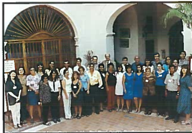
Alumnos del curso de Formación y Supervisión de Proyectos en Gerontología.