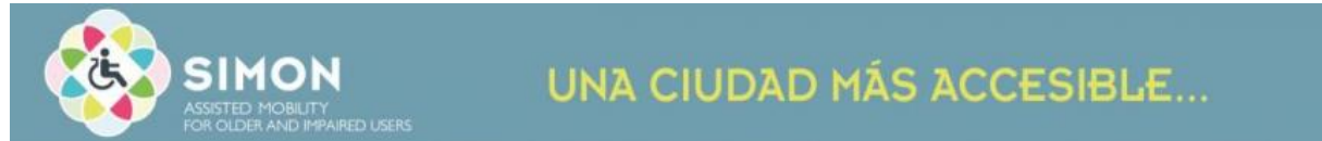
Logotipo del proyecto SIMON

Financiado por la Comisión Europea dentro del Programa Marco de Innovación y Competitividad, El proyecto SIMON (Assisted Mobility for Older and Impaired Users) se ha iniciado como proyecto piloto en las ciudades de Madrid, Lisboa, Parma y Reading. Los usuarios pueden ya usar el sistema en condiciones reales y validarlo.