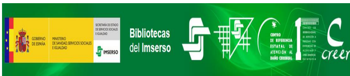
Logotipo en la página de acceso a las Bibliotecas del Imserso

Este servicio pone a disposición de las personas interesadas un conjunto de 30.000 referencias que pueden localizarse y consultarse fácilmente gracias a la disponibilidad en línea del catálogo colectivo. La consulta del catálogo puede hacerse de forma conjunta en todas las bibliotecas citadas o de forma individualizada en cada una de ellas.