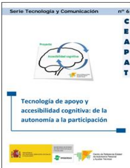
Portada del documento

Este documento, el Nº 6 de la serie “Tecnología y Comunicación”, es el resultado de un proyecto, coordinado por el Ceapat, en el que han participado numerosas entidades, profesionales y usuarios, y que ha tenido en cuenta la diversidad que puede darse en el funcionamiento cognitivo de las personas.