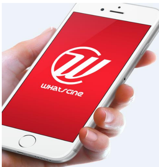
Foto del sistema WhatsCine en la pantalla de un smartphone

WhatsCine es un sistema que permite disfrutar del cine y la televisión a las personas con discapacidad visual o auditiva a través de audiodescripción, lengua de signos y subtulado adaptado. Funciona en smartphone o tablet mediante aplicaciones gratuitas para iOS y Android y no necesita de pantallas secundarias ni monitores portátiles.