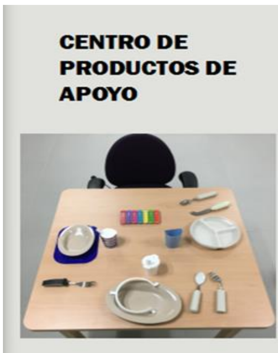
Portada del tríptico informativo

Tras varios años de proyectos, propuestas y preparación, el pasado mes de enero se abrió al público el Centro de Productos de Apoyo de Navarra, dependiente del Departamento de Derechos Sociales del gobierno de la Comunidad Foral.