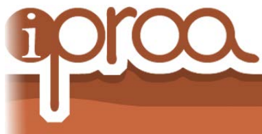
Logotipo del Foro iProA

En línea con los nuevos formatos de presentación de todos los sitios web que constituyen la plataforma web del Imsero, el minisite del Foro iProa , alojado en ella a través de la web del Ceapat, conjuga un diseño más atractivo y funcional con el empleo de una iconografía propia.