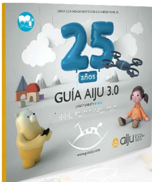
Portada de la Guía Aiju de juegos y juguetes

Guía Aiju 3.0: Juego y juguete 2015-2016 / Aiju. Instituto Tecnológico de Producto Infantil y Ocio. Ibi (Alicante): Aiju, 2015. 121 págs.