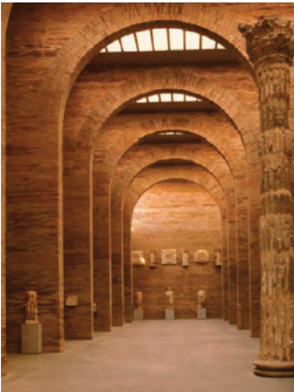
Museo de Arte Romano

Para la puesta en práctica de estas medidas se tendrá en cuenta la perspectiva de género, haciendo así mismo de la accesibilidad un valor a tener en cuenta y a disfrutar desde las etapas infantiles. Un órgano interministerial,