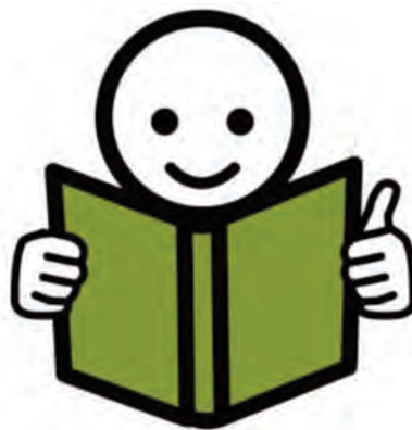
Pictograma "lectura fácil" (Arasaac)