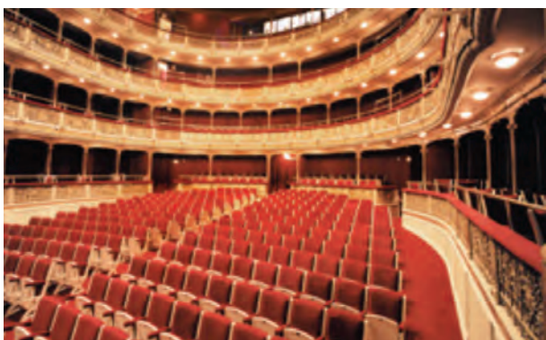
Teatro María Guerrero

El Instituto de las Ciencias y de las Artes Audiovisuales (ICAA) incentiva, junto a las Comunidades Autónomas, a las salas de exhibición que proyecten en digital cine europeo e iberoamericano. Estas proyecciones digitales permiten de forma fácil, rápida y económica, implementar medidas que permitan el acceso a los contenidos a las personas con discapacidad.