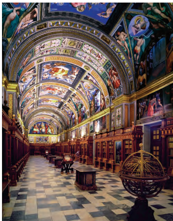
Monasterio de El Escorial

Patrimonio Nacional, en colaboración con el Real Patronato sobre Discapacidad y la Fundación ACS, está desarrollando un programa de accesibilidad para personas con discapacidad física y movilidad reducida para el conjunto de sus edificios e instalaciones, como el Monasterio de San Lorenzo de El Escorial, el Monasterio de Las Huelgas de Burgos y el Convento de Las Dueñas, en Tordesillas.