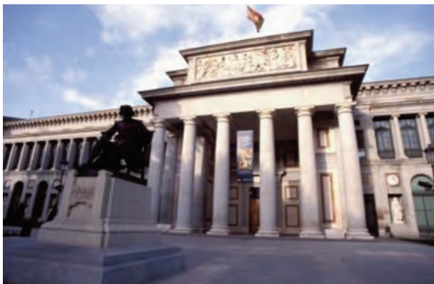
Museo del Prado

Como novedades en este plan se pueden destacar las siguientes: inclusión de los criterios de accesibilidad en la auditoría de los espacios y servicios culturales del Ministerio de Cultura, promoción del cine subtulado y del teatro accesible, dotación a los museos estatales de guías multimedia y adopción de programas de lectura adaptada para personas con discapacidad intelectual. También se pretende apoyar económicamente la creación de un Foro de seguimiento de todas estas iniciativas.